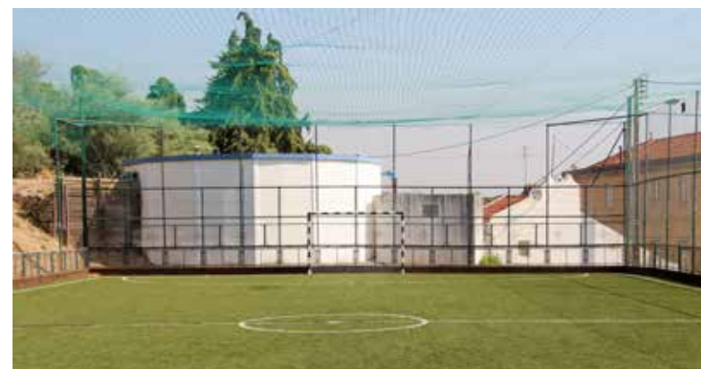
POLIDESPORTIVO DO BREJO

Nos equipamentos desportivos de Alverca do Ribatejo e de Vila Franca de Xira foi realizada uma intervenção de manutenção e conservação. Através de um investimento de 113 622,76€ (acrescido de IVA), a Câmara Municipal promoveu obras de conservação e melhoramentos no Campo de Basquetebol da Praceta das Oliveiras (execução de um novo campo de basquetebol com pavimento de betão poroso, instalação de equipamentos e pintura de linhas e renovação da zona verde na envolvente) e no Polidesportivo do Brejo (reabilitação do campo existente com aplicação de relva sintética, instalação de nova rede de proteção e vedação, pavimentação de todo o espaço envolvente do campo, plantação de árvores), ambos os equipamentos localizados em Alverca do Ribatejo. Também nesta cidade, o Pavilhão Municipal de Alverca foi intervencionado ao nível dos balneários (atletas e árbitros), num total de 49 298,48€ (IVA incluído), através da colocação de nova tubagem e louça sanitária.