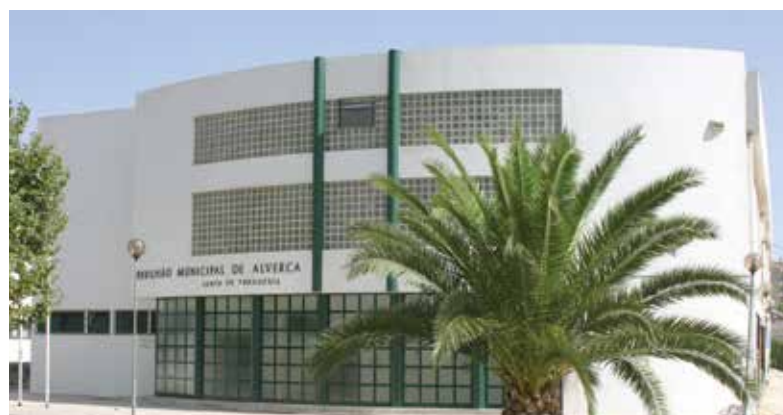
PAVILHÃO MUNICIPAL DE ALVERCA

de 74 611,70€ (IVA incluído), dotou-se os balneários das piscinas do Forte da Casa e da Póvoa de Santa Iria de melhores condições, nomeadamente neste último que se adaptou a o espaço ao uso por pessoas com mobilidade reduzida.