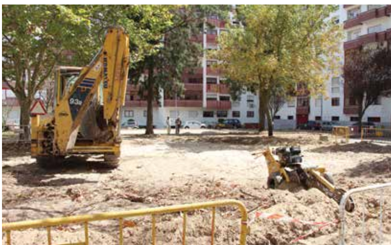
CAMPO DE BASQUETEBOL DA PRACETA DAS OLIVEIRAS

A Administração no âmbito da gestão das verbas afetas ao Orçamento Municipal tem sempre muito presente a qualidade de vida da população, sendo dado especial enfoque à manutenção, reabilitação e construção dos equipamentos desportivos. No contexto dos últimos investimentos há a ressaltar a remodelação das Piscinas Municipais concelhias e as obras de conservação e melhoramentos do Campo de Basquetebol da Praceta das Oliveiras, do Polidesportivo do Brejo e do Pavilhão Municipal de Alverca (Alverca do Ribatejo). Ao nível da intervenção realizada nas Piscinas Municipais, pela verba