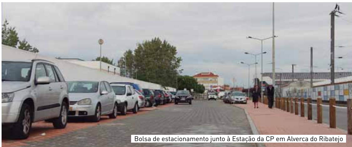
Bolsa de estacionamento junto à Estação da CP em Alverca do Ribatejo

Com rigor, equilíbrio e responsabilidade, o Município ocupa a 3ª posição no ranking global da eficiência financeira, sendo que no setor empresarial local e Serviços Municipalizados no setor autárquico, os SMAS de Vila Franca de Xira, que ocuparam o 3º lugar em 2013, ascenderam em 2014 ao 2º lugar, num quadro nacional com 29 entidades.