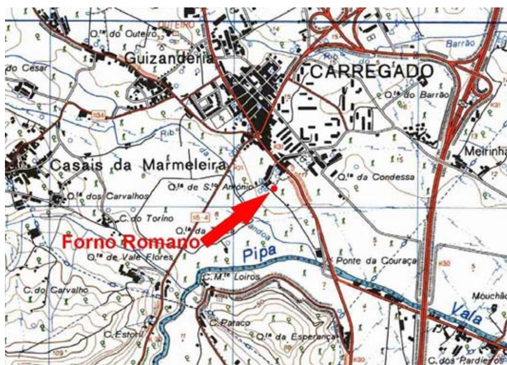
Figura 3 Localização do Forno da Quinta de Santo António (estrato da CMP 390, 1:25.000)

O sítio é referenciado no Plano Diretor Municipal de Alenquer como local de dispersão superficial de cerâmica, contextualizável em período romano, embora não se encontrasse qualquer menção a esse respeito na base de dados do Instituto Português de Arqueologia . Integra-se, no entanto, num eixo de intensa distribuição de testemunhos de ocupação em