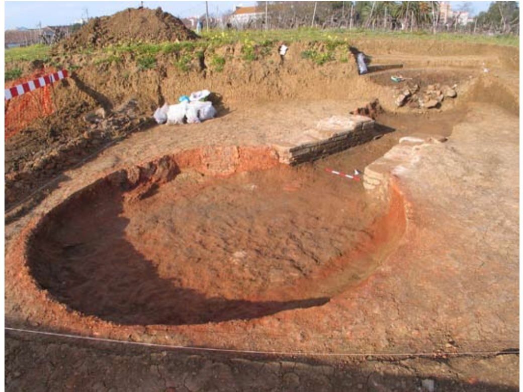
Figura 4 Perspetiva Geral do Forno da Quinta de Santo António.

forma consistente, devido à escassez de informação, embora se possa adiantar a hipótese plausível de que, em princípio, se devesse ter vocacionado como pequena unidade de produção de cerâmica. Numa segunda fase de aproveitamento, estaria relacionado com transformação de cal. Neste processo estaria sujeito a fogo direto no interior da câmara, afirmação sustentada pela vitrificação patente nas paredes interiores. O anel de 35cm de largura de argila rubefacta, sobreaquecida, que circunda a estrutura atesta as altas temperaturas atingidas. Este fenómeno não se verifica no paralelo da herdade vizinha.