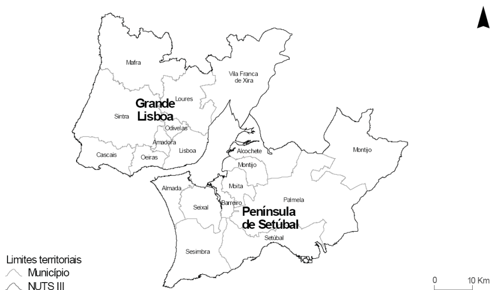
Fig. 1 - Área Metropolitana de Lisboa – divisão por NUTS III e Municípios

O concelho de Vila Franca de Xira é um dos 18 concelhos que compõem a Área Metropolitana de Lisboa (Lisboa NUTS II), que é composta pela totalidade dos concelhos que constituem a Grande Lisboa e Península de Setúbal (ambas NUTS III).