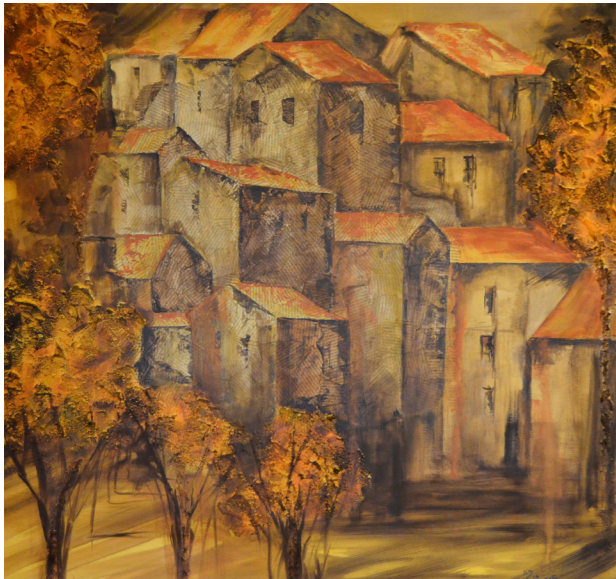
1 Aldeia Acrílico s/tela com textura 80x80cm