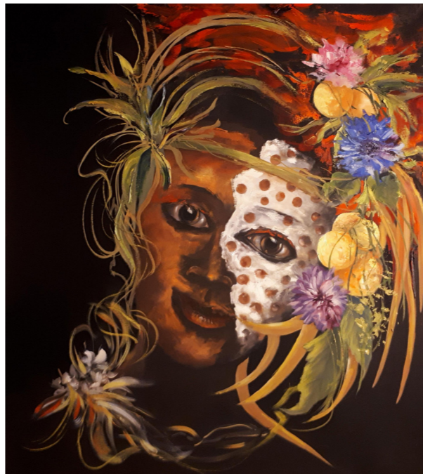
3 Dia de festa Óleo s/tela 80x70cm