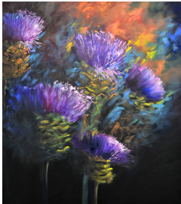
4 Flores de alcachofras Óleo s/tela 90x80cm