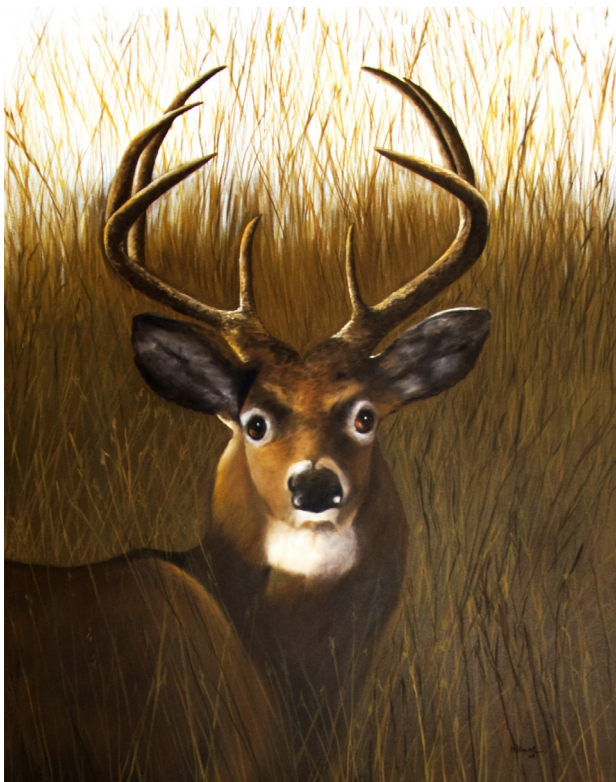
2 Veado Óleo s/tela 80x100cm