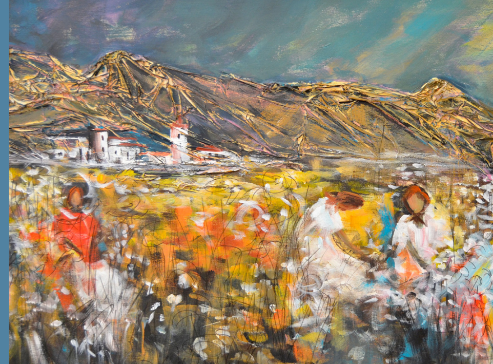
FOTO DE CAPA [pormenor] Apanha do algodão Acrílico s/tela com textura 65x110cm

À criação pessoal juntou a vertente de formação, pela vontade e prazer de ensinar e aconselhar, no Mia Costa Atelier de Artes na Covilhã, cidade onde reside atualmente.