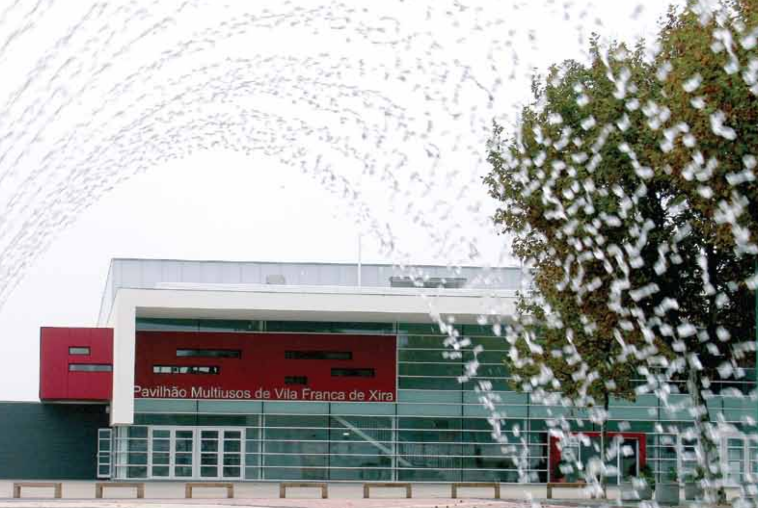
Pavilhão Multiusos de Vila Franca de Xira

25 Km north from Lisbon , Vila Franca de Xira offers you the best solutions for events, with the quality demands of market and modern times.