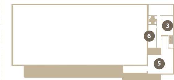
Piso superior . 6 | serviços técnicos