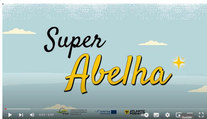
Figura 3 – “Filme Super abelha” elaborado pelo INIAV.

Pode também assistir a um vídeo estruturado pelo INIAV no âmbito do Projeto Positive, que tem como objetivo dar a conhecer, para um público alvo alargado, a espécie Vespa velutina :