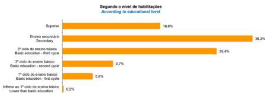
*Grau de qualificações da população ativa

Em termos económicos, o Concelho de Vila Franca é caracterizado por um setor terciário muito forte, seguido pelo setor secundário, no que diz respeito ao setor primário representa menos de 1%.