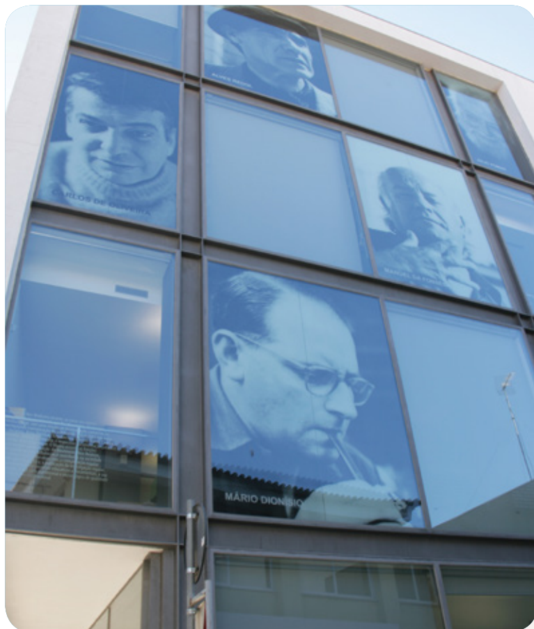
Museu do Neo-Realismo

Atividade lúdica que pretende dar a conhecer o período neorrealista português. Dirigida a crianças a partir dos 6 anos, mediante inscrição prévia, até 5 dias de antecedência, para o tef. 263 285 626 ou neorealismo@bcm-vfxira.pt. A realização obedece a um mínimo de 10 e um máximo de 20 participantes Museu do Neo-Realismo, Vila Franca de Xira