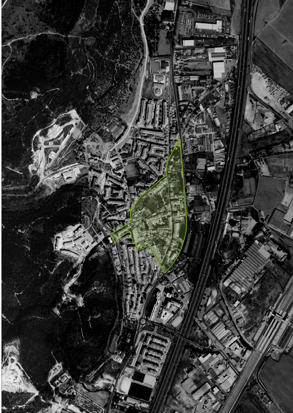
ARU - Castanheira do Ribatejo

Sistema de Projeção: Hayford Gauss, Datum 73 Criado por SIG Municipal de Vila Franca de Xira, Junho de 2015